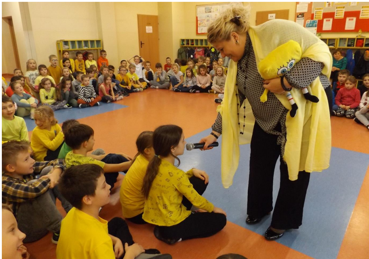
Apel z okazji DNIA ŻYCZLIWOŚCI-kolor żółty króluje.