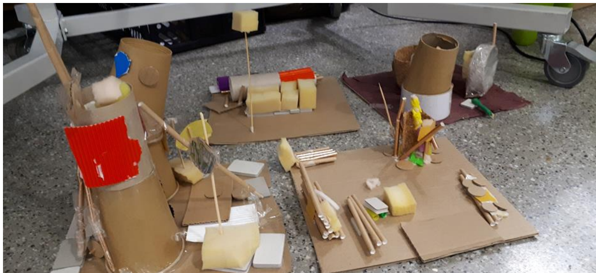
To nasze projekty domów na Marsie-klasa 1b

Na te i na inne pytania wspólnie szukaliśmy odpowiedzi w CENTRUM POZNAWCZYM HALI STULECIA.