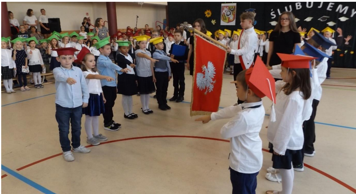
Pierwszoklasiści odważnie złożyli ślubowanie na sztandar,