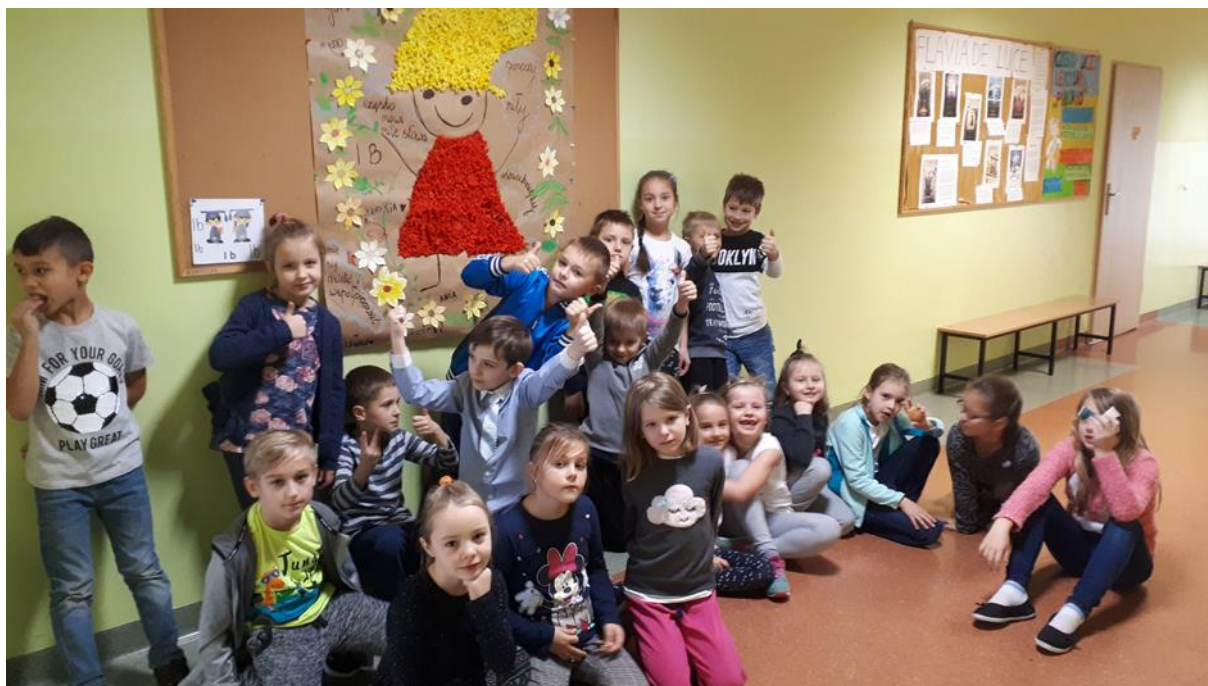
A to ŻYCZLIWEK-plakat wykonany przez klasę 1b