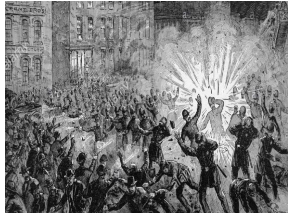
Ryciny przedstawiające wydarzenia w Chicago.