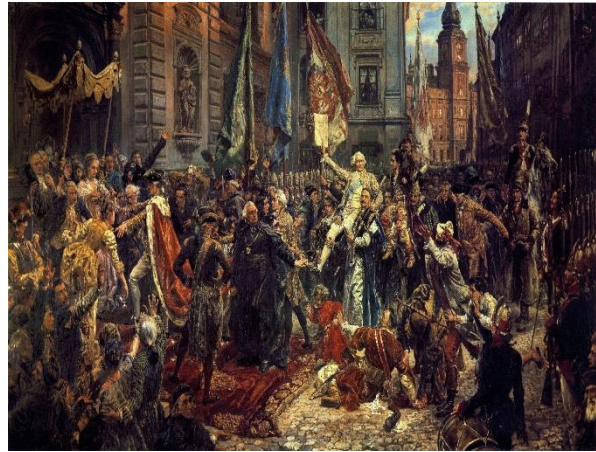
Jan Matejko, Konstytucja 3 maja 1791 roku , 1891r.