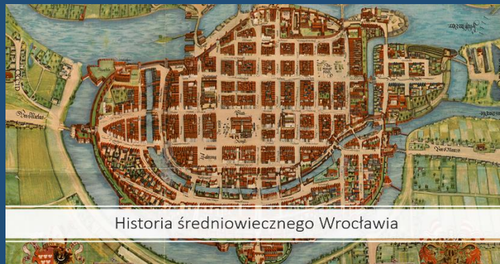
Historia średniowiecznego Wrocławia