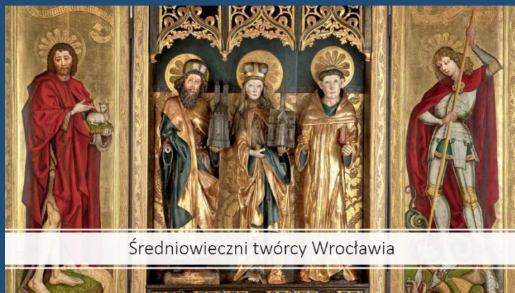
Średniowieczni twórcy Wrocławia